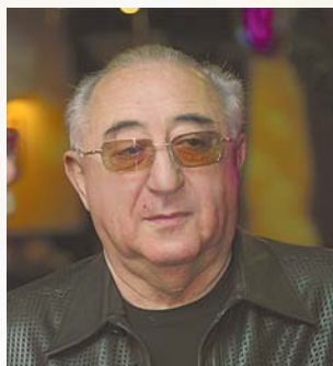
Гройсман Виталий Александрович