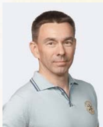
Чабан А.С. Паст - Президент