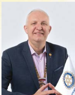
Гридчин А.А. Президент